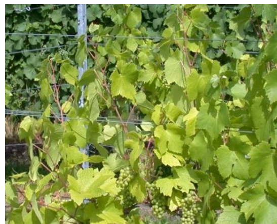
Stickstoffmangel. Schwachwüchsige Reben, hellgrüne Blätter mit roten Blattstielen, frühe Herbstverfärbung

Nach dem Umbruch einer langjährigen Begrünung oder der Einarbeitung von Leguminosen wie Winterwicke oder Kleegras-mischungen ist keine N-Düngung notwendig. N-Mangel durch eine ungeeignete Bodenpflege oder Wassermangel lässt sich nicht durch eine überhöhte Düngung ausgleichen. Wuchsunterschiede in der Rebanlage (Magerstellen, mastige Bereiche) sollten bei der N-Düngung beachtet werden.