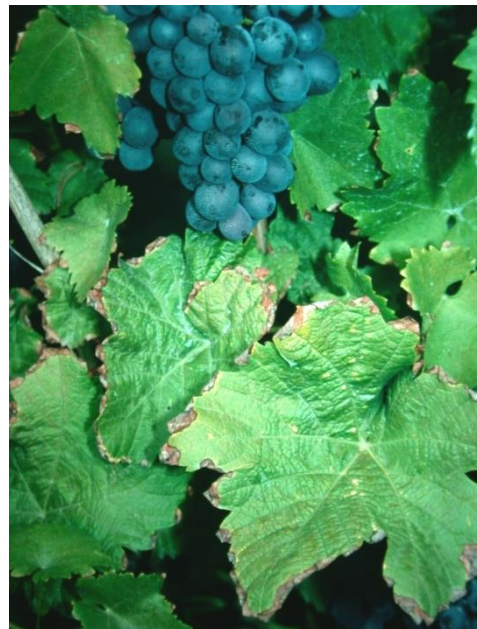
Vertrocknete Blattränder bei Kalimangel.

Die Bodenproben sollen vor einer Grunddüngung aus der Bodenschicht von 0 - 30 cm entnommen werden. Aus 0 - 60 cm Tiefe wird bei Bodenuntersuchung nach der EUF-Methode oder wenn eine tief wendende Bodenbearbeitung geplant ist entnommen. Wenn die Entwicklung der Nährstoffgehalte langfristig beobachtet werden soll, sollte die gleiche Beprobungstiefe beibehalten werden.